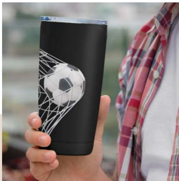
TH 07 Termo Vitex