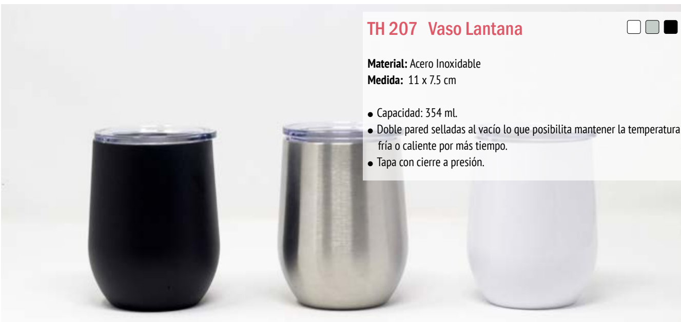
TH 207 Vaso Lantana